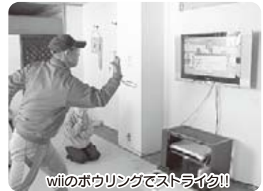
wiiのボウリングでストライク!!

運動が必要な方は、公園で散策をした後におやつをとったり、また、のんびりと喫茶店でコーヒーを飲んだりする方もおられます。クラブも外出も利用者の方がとても楽しみにされていることなので、時間を過ごせるように心がけています。また、誕生日の月には誕生日外出を行っています。いつもの外出よりしっかりと時間を取り、外食や買い物、映画を見たりと利用者の方の望まれていることが行えるようにしています。