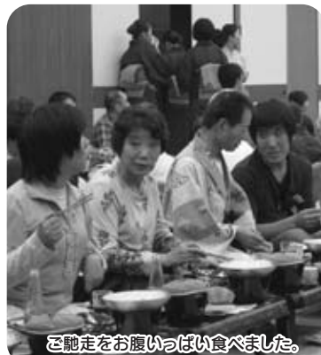
ご馳走をお腹いっぱい食べました。

今回の旅行は、利用者、家族のみなさんと密に関わることで、とても良い機会となりました。このような交流の機会を、今後も何らかの形で残せていければ良いと感じています。ご協力、本当にありがとうございます。