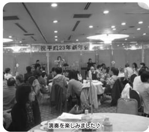
演奏を楽しみました!

1月20日に水島国際ホテルで恒例の新年会が行われました。昨年はこの時期に新型インフルエンザ警報が発令されていたため、学園内で新年会を行いました。2年ぶりの水島国際ホテルでの新年会は通所・入所の利用者のみなさんと職員が一堂に会し、参加者は160人を超え盛大な会となりました。ゲストの方の演奏では一緒に歌ったり拍手をしたりとみなさん思いおもいに楽しまれていました。