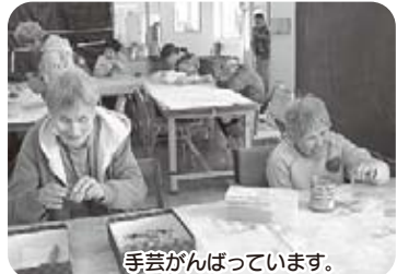
手芸がんでいます。

秋には落ち葉で焼き芋をすることもありました。ゲームクラブはwiiを使って楽しみ、運動クラブでは、室内でパランスボール等を使用したり、福田公園に行き、すっかりウォーキングをしたりと肥満対策を行っています。カラオケクラブはみんなの大好きなメニューで、「私は〇〇を歌う。」「次は私の番じやな。」と楽しんでいます。