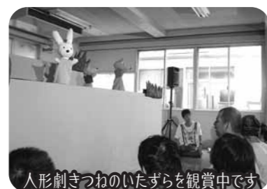
人形劇きつねのいたずらを観賞中です

倉敷市立短期大学学生ボランティアによる人形劇講演が開催されました。夏の間も少しずつ和らいできた9月中旬、倉敷市立短期大学の学生ボランティアによる人形劇が披露されました。人形は全て手作りの為、とても温かみがあり、台詞の二つひとつに気持ちが込められた素晴らしい人形劇講演となりました。講演終盤で披露された学生ボランティアの皆さんが歌う手遊びでは、一緒に歌を歌ったり、手遊びを真似たりする利用者の皆さんの姿がありました。