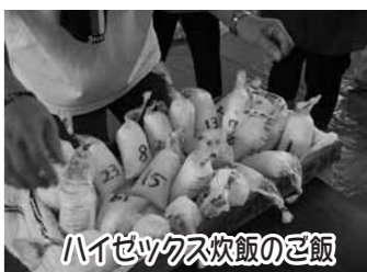
ハイセックス炊飯のど飯

10月14日(日)に大地震・津波を想定し、連島東小学校まで避難する防災訓練に参加しました。若草地区にある3つのケアホームの入居者とスタッフ、そして町内の方々と一緒に歩きました。連島東小学校までは片道2km弱。途中の茂浦公民館では高台へ登れる道を確認したり、崩れた家の傍を通る時の注意点の説明も受けました。避難場所の体育館に着いてからは、実際に避難食も食べてみました。町内の方々から「頑張って歩いたね」と声を掛けて頂いたり、入居者の方を視野にいれての訓練、「ありがたいなあ」と思いました。