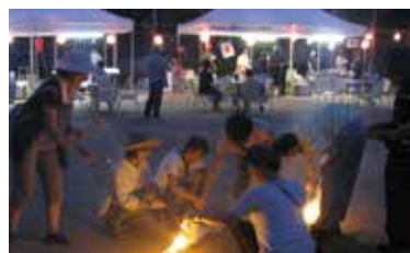
若草夏祭りの一コマ

若草ホームの近隣の方との交流を図り、理解を深めていただくことを目的に、平成23年から8月に連島第二公園にて若草夏祭りを開催しています。当初からたくさんの方に来ていただき、おかげさまで今年で4回目です。