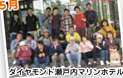
ダイヤモンド瀬戸内マリンホテル