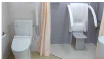
ほほえみ寮新設トイレ