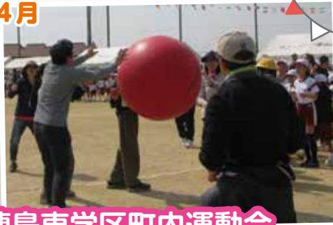
連島東学区町内運動会