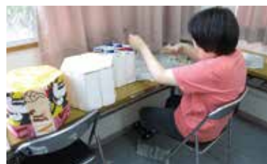
仕事がんばってます