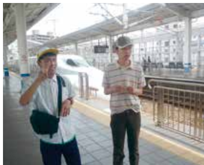
電車で岡山駅に行きました

H23年度から、「誕生日外出」というサービスに取り組んでいます。誕生日に利用者の方の希望に合わせて、おいしい物を食べたり、行きたい所に行ったり、やりたいことが叶えられるようお手伝い