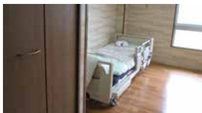
ほほえみ寮ベッド部屋

これからも、利用者の皆様が安全で快適に過ごしやすい環境作りに努めていきたいと思えます。