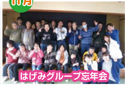
はげみグループ忘年会