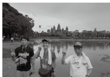
アンコールワットにてピース

日本とは違う文化に触れ、人々の逞しさや力強さを肌感じつつ、いかに自分たちが恵まれた環境下で生活が送れているかといった事を痛感した、有意義な5日間でした。