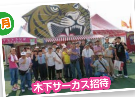
木下サーカス招待