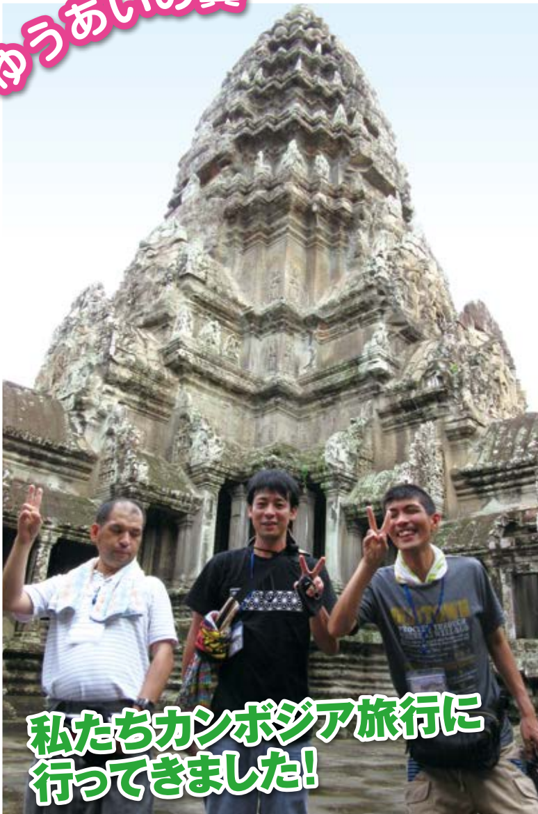
私たちがカンボジア旅行に行ってきました!