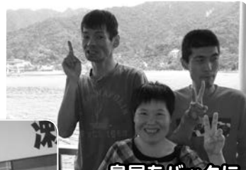
鳥居をバックにピース!