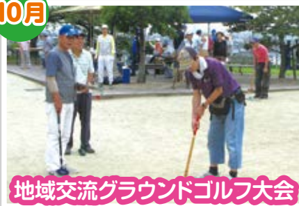
地域交流グラウンドゴルフ大会