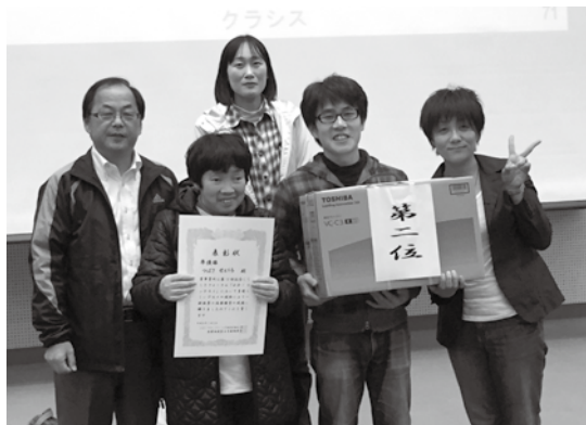
やったぜ! AB-1 コンテスト準優勝!

んど降らないので、皆さん大はしゃぎで、雪合戦をしたりと雪を触って楽しまれました。温泉は雪景色の中の露天風呂!寒い季節にあつたかい温泉につかるのは最高ですね!食事も、食べきれないほどのごちそうがたくさん出て、千屋牛は特に絶品でした。 身も心もほぐれて、十分リラククスしたご様子。さあ、明日から仕事がんばるぞ!と、意気込みも十分に帰ってきました。