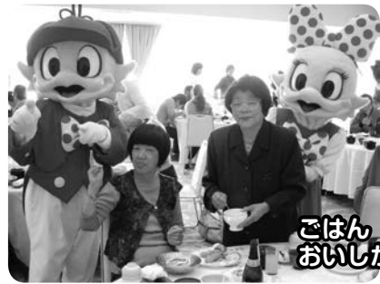
ごはんおいしかったよ!