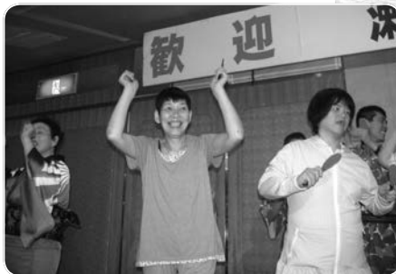
しゃもじでダンス!