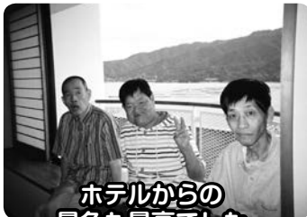
ホテルからの景色も最高でした

よると、厳島神社は女性の神様を祭っているため、カップルでお参りすると、神様がヤキモチを焼いてしまうとか・・・。そんな逸話を聞きながら、周遊を堪能しました。昼食は、広島と言えはやっぱり「かきー」ということで、かき飯に舌鼓を打ち、お土産も広島ならではの土産品を皆さんどっさり買われていました。ゆったりりのんびり旅行でしたが、利用者様、ご家族、職員の親睦も深まり、また新しい旅の一ページを綴ることができました。