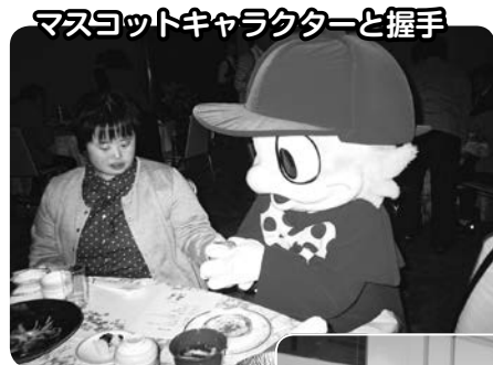
マスコットキャラクターと握手